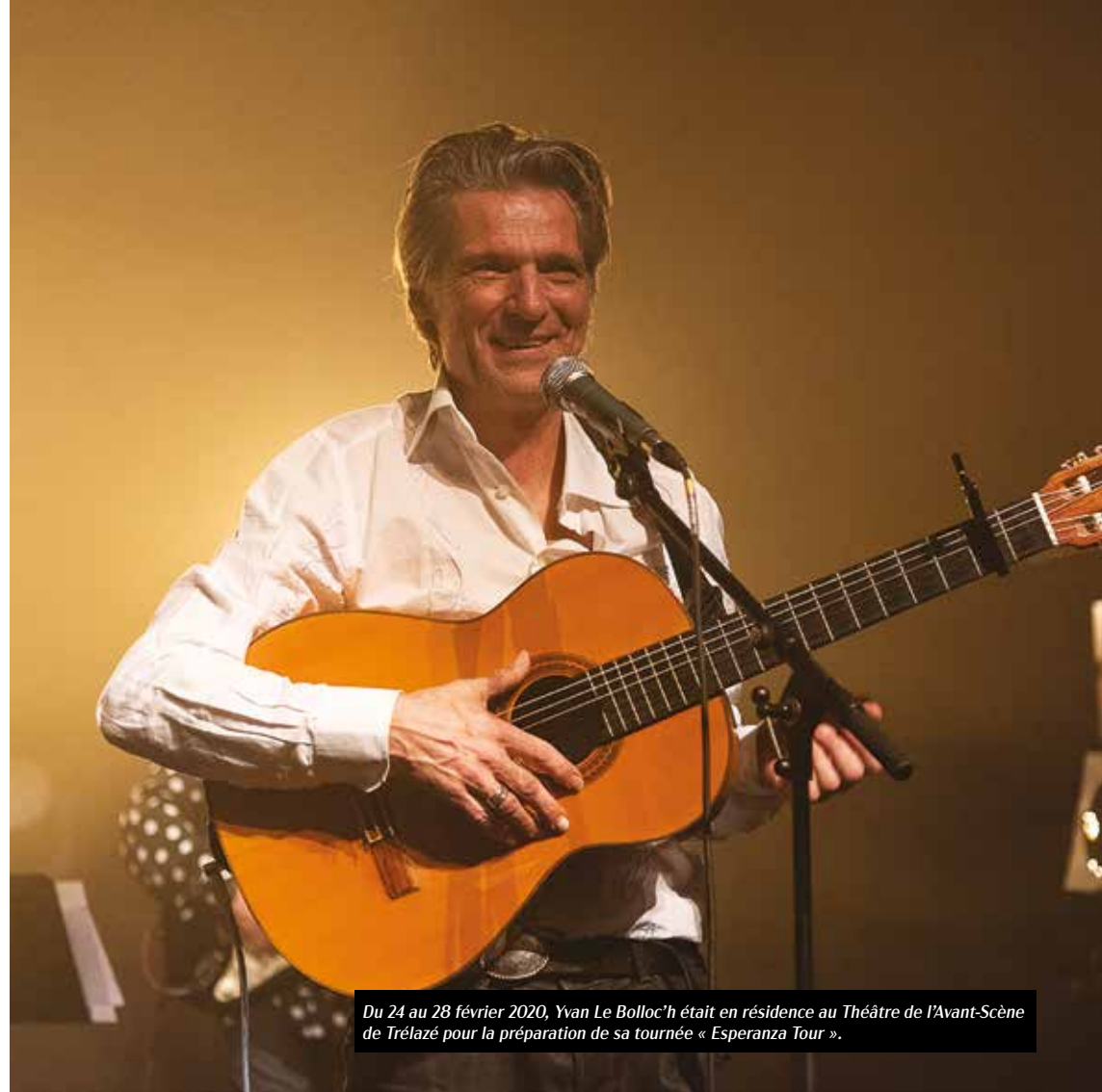
Du 24 au 28 février 2020, Yvan Le Bolloc'h était en résidence au Théâtre de l'Avant-Scène de Trélazé pour la préparation de sa tournée « Esperanza Tour ».

109 Cie/Gabrielle Poirier 109compagnie@orange.fr 07 49 15 09 30